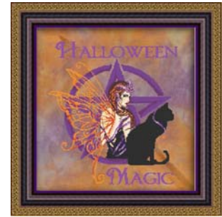
Fabric: 28ct Jobelan " Monster Mash" http://www.fabulous-fabrics.com/store/p363/Monster_Mash.html