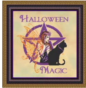
Fabric: 28ct Jobelan " Fallen Leaves" http://polstitchesdesigns.co.uk/Fabrics.html